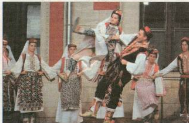
KUD »Milan Begović«