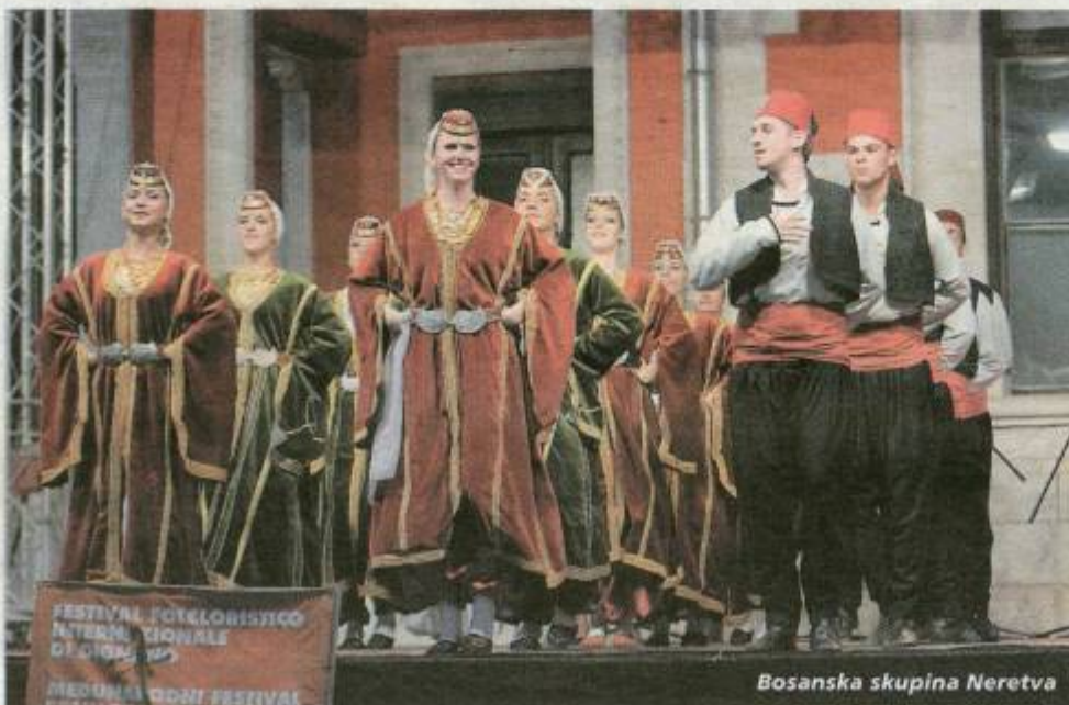
Bosanska skupina Neretva

I ovog puta popraćen brojnom publikom, Le- ron je ugostio folklorne skupine iz BiH, Italije, Albanije i Hrvatske. Deset folklornih skupina prekjučer je prodefiliralo Trgovačkom ulicom i na glavnom trgu predstavilo različite kulture