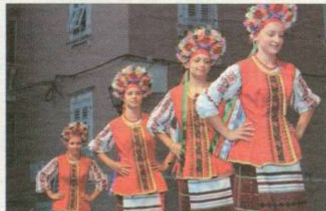
Ukrajinski ples izvode djevojke iz Šumeča