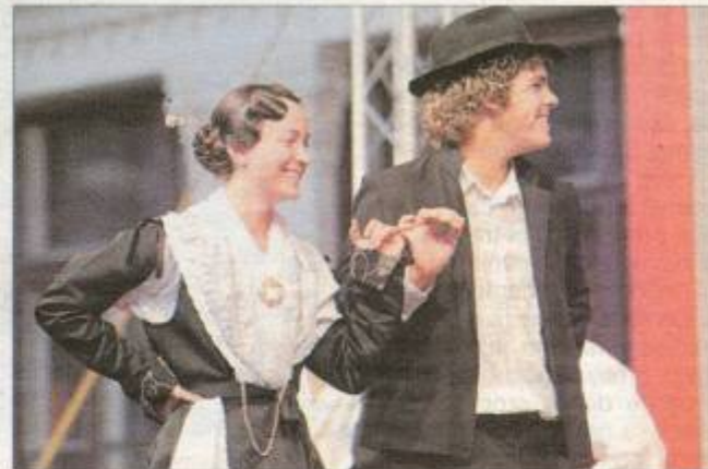
Par iz folklorne skupine galizijske Zajednice Talijana